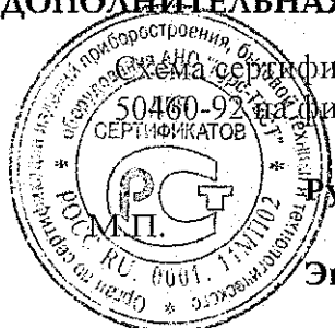
Схема сертификации – За. Продукция маркируется Знаком соответствия по ГОСТ Р 50460-92 на фирменной табличке, в руководстве по эксплуатации, на упаковке.